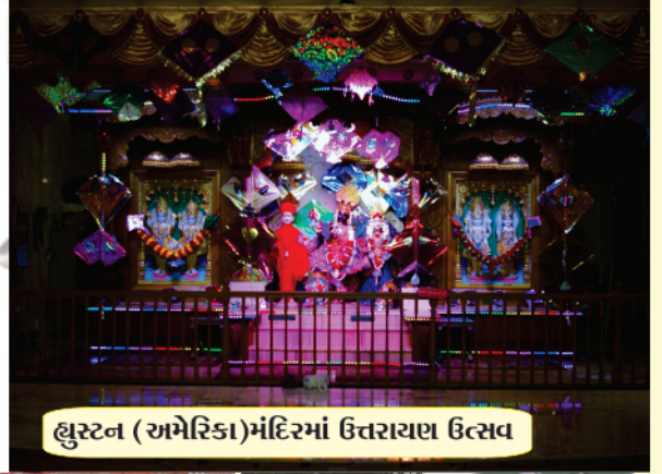
હ્યુસ્ટન (અમેરિકા) મંદિરમાં ઉત્તરાયણ ઉત્સવ