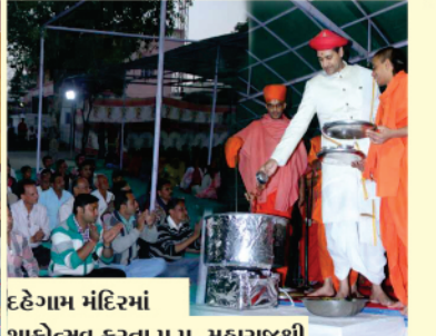
દહેગામ મંદિરમાં શાકોત્સવ કરતા પ.પૂ. મહારાજશ્રી