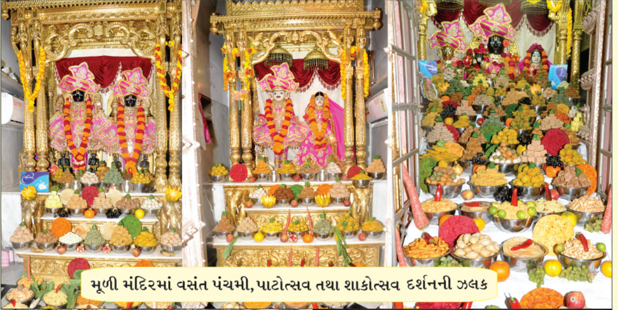
મૂળી મંદિરમાં વસંત પંચમી, પાટોત્સવ તથા શાકોત્સવ દર્શનની ઝલક