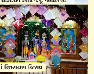
શિકાગો (અમેરિકા) મંદિરમાં ઉત્તરાયણ ઉત્સવ