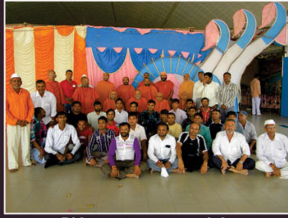
હિંડોળા ઉત્સવ ભુજમાં સેવા આપનાર સંતો તથા હરિભક્તો