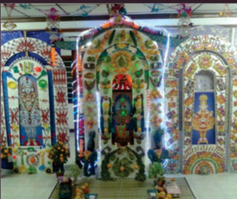
શિસલ્સ હિંડોળા દર્શન