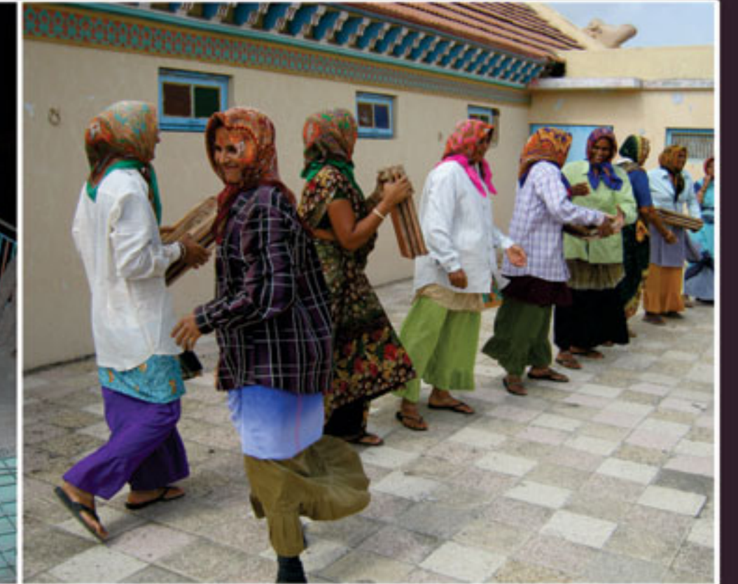
નારણપર નિ.વા. હિંડોળા દર્શન તેમજ સેવા કરતા ભાઈઓ તથા બહેનો