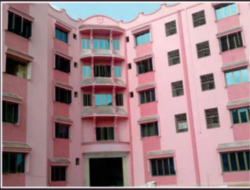
વિશ્રાંતિ ભવન ગાંધીનગર