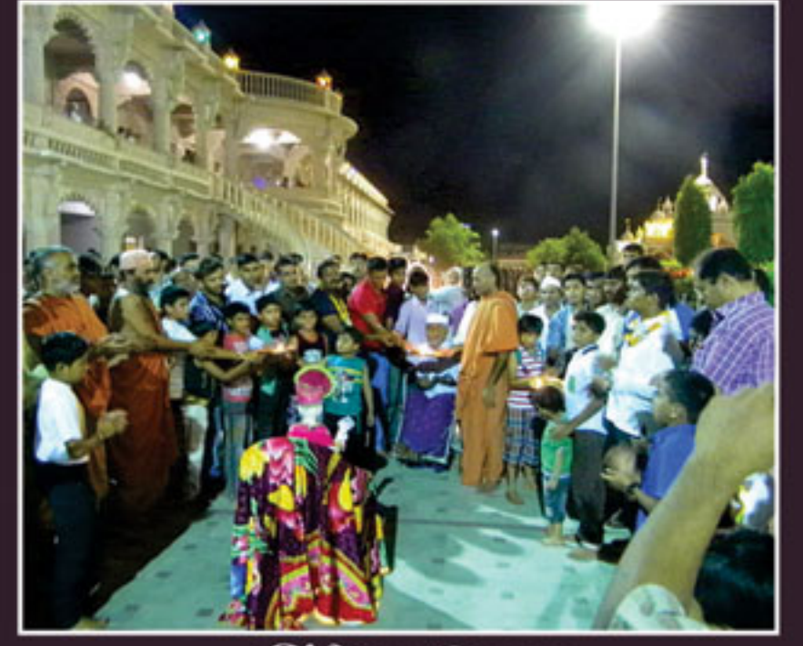
હિંડોળા ઉત્સવ સમાપ્તિમાં મહાઆરતી