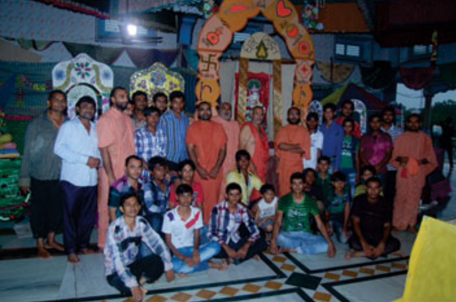
શ્રી સ્વામિનારાયણ મંદિર રાપર વાગડમાં હિંડોળા તથા પ્રદર્શન