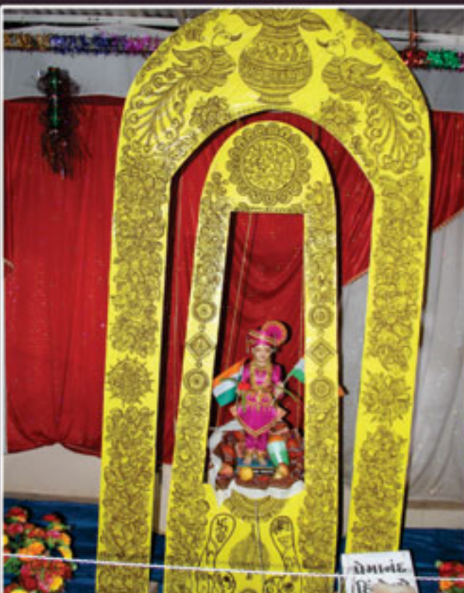
નરનારાયણ નગર, સુખપર