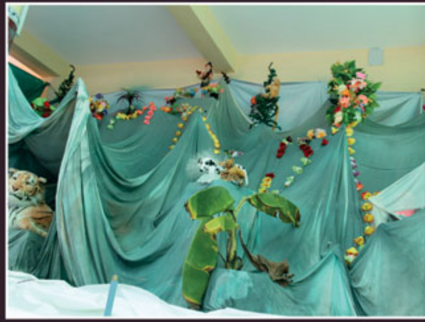
બળદેવિયા નિ.વા. હિંડોળા દર્શન