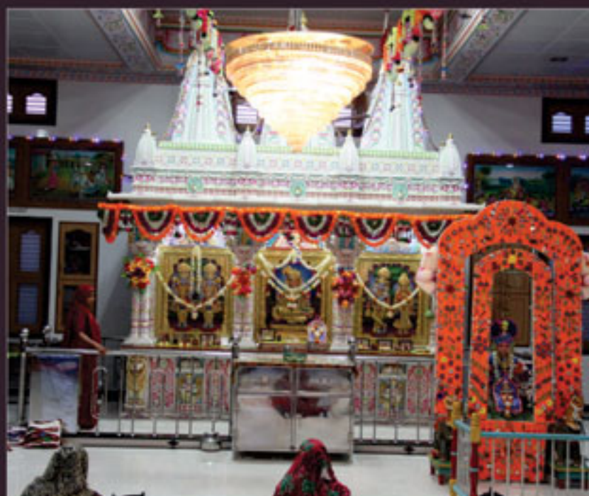
માનકુવા હિંડોળા દર્શન