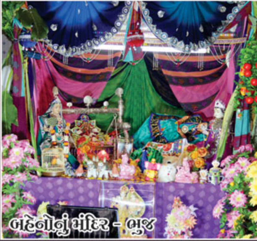
બદોળી મંદિર - ભુજ