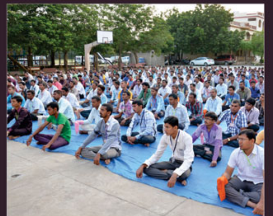
ગાંધીધામ ગુરૂકુળમાં કર્ચ શ્રી નરનારાયણદેવ યુવક મંડળના યુવાનો માટે - કાર્યકર્તા શિબિર