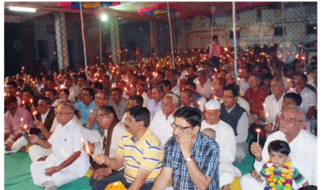
અંજાર : સ્વામિનારાયણ મંદિરમાં શાકોત્સવ તથા ધનુર્માસની પૂર્ણાહુતિમાં મહાઆરતી કરતા ભક્તો