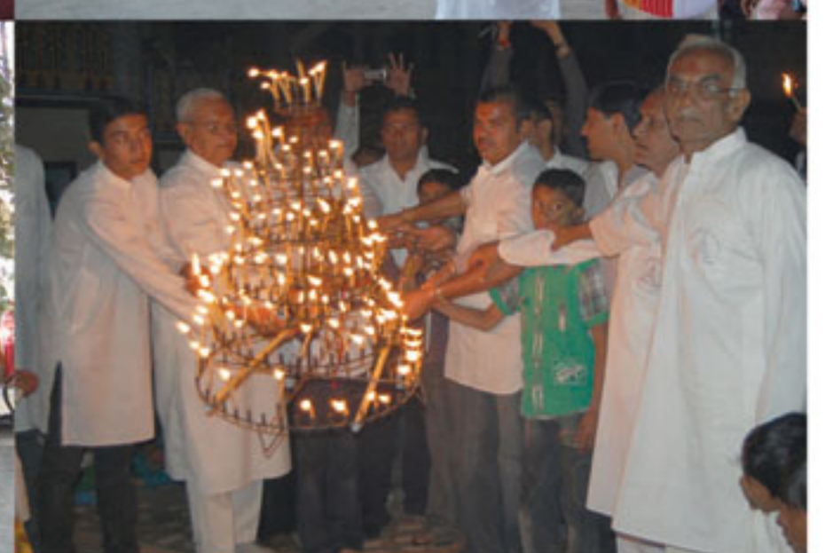
નારાણપર (પસાયતી) મકરસંક્રાંતીને દિવસે ગાયોના ચારા માટે સંધ્યાફેરી તથા વિવિધ કાર્યક્રમો