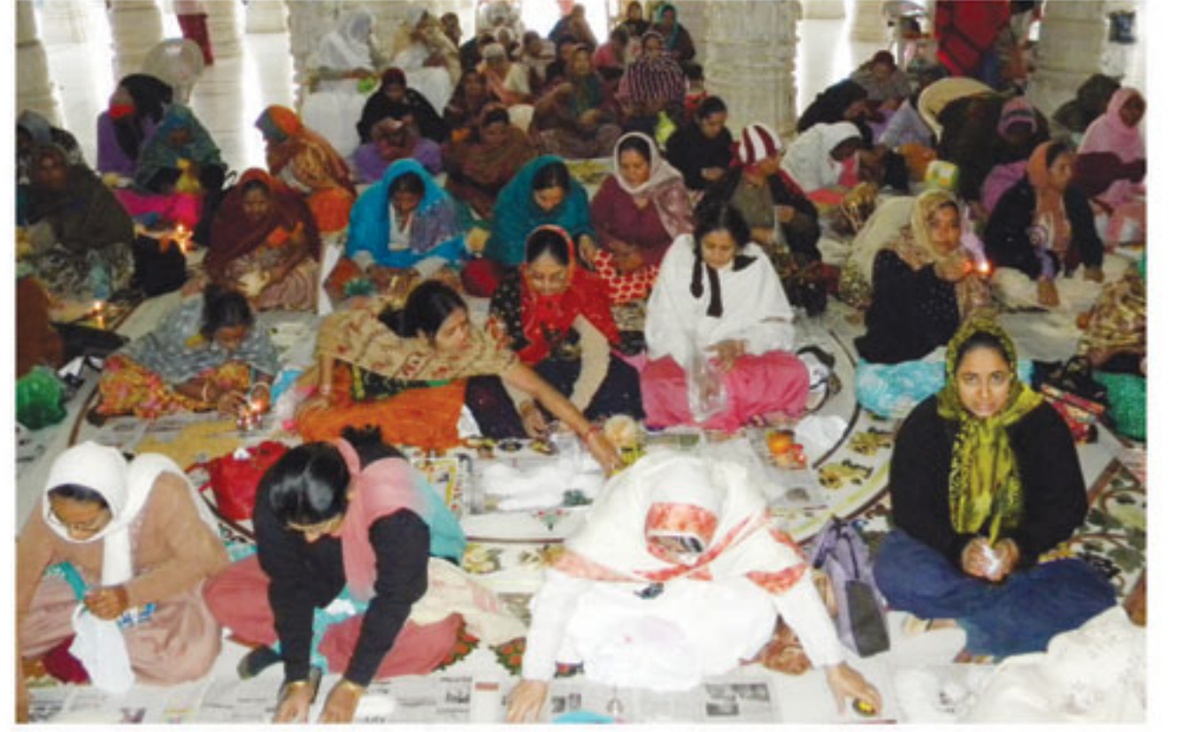
ભુજમાં પૂર્ણિમાના દિવસે સાથીઓ પૂરતાં બહેન ભક્તો