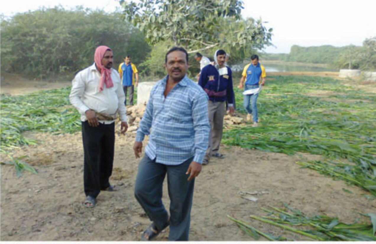
આમારા : મકરસંક્રાંતીને દિવસે ગાયોના ચરાનું નહેર કરતા ભક્તો