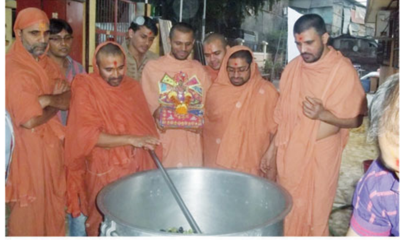
શ્રી સ્વામિનારાયણ વિશ્રાંતી ભુવનમાં ધનુર્માસમાં ધુન તથા શાકોત્સવ. મુંબઈ-પાર્લે