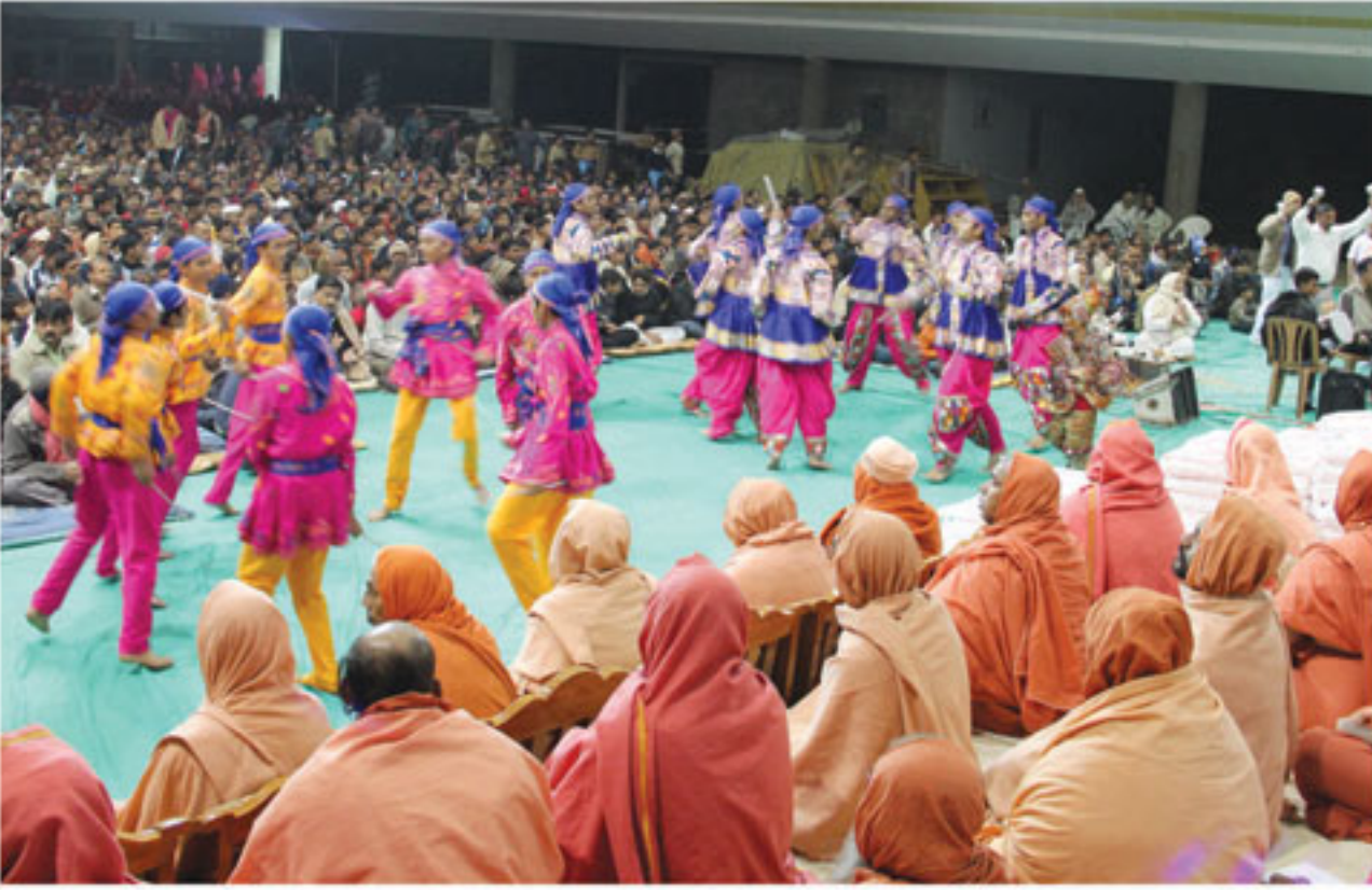
ચાલતી મહામંત્રની ધુનમાં તન્મય સંતો, ભક્તો અને નૃત્ય કરતા આપણા સત્સંગી યુવાનો, ભુજ.