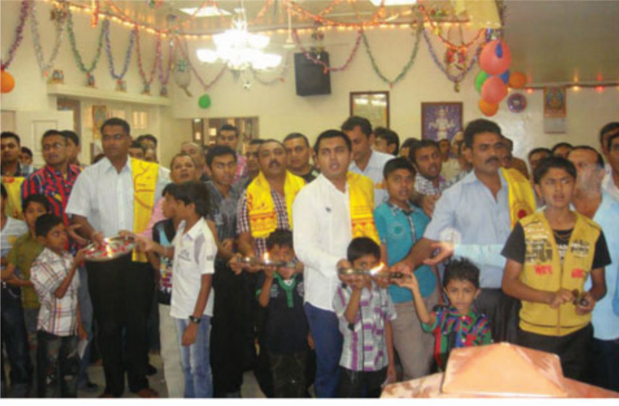
શ્રી સ્વામિનારાયણ મંદિર કંપાલા (ચુગાન્ડા)માં કથા પ્રસંગે આરતી ઉતારતા ભક્તો