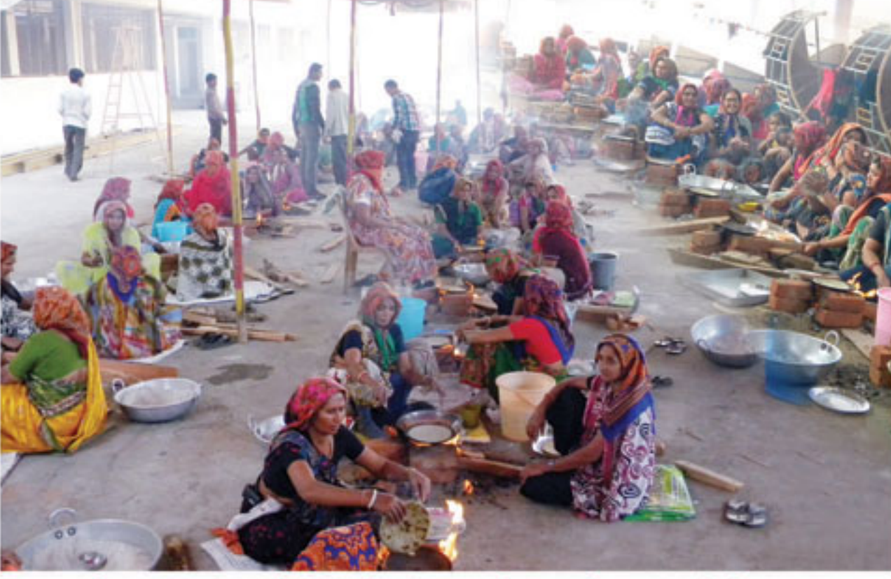
સેવાભાવી બહેનો વહેલી સવારે શાકોત્સવમાં રોટલા તૈયાર કરવા લાગ્યા હતા, ભુજ.