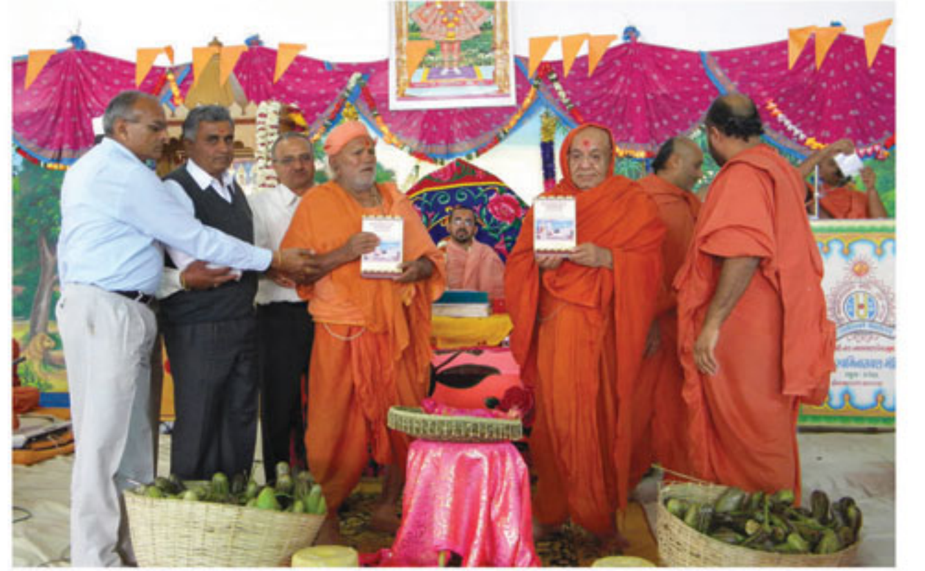
ઈંગ્લીશ શ્રીમદ્ ભગવદ્ગીતાભાષ્યનું વિમોચન કરતા સંતો, ભુજ.