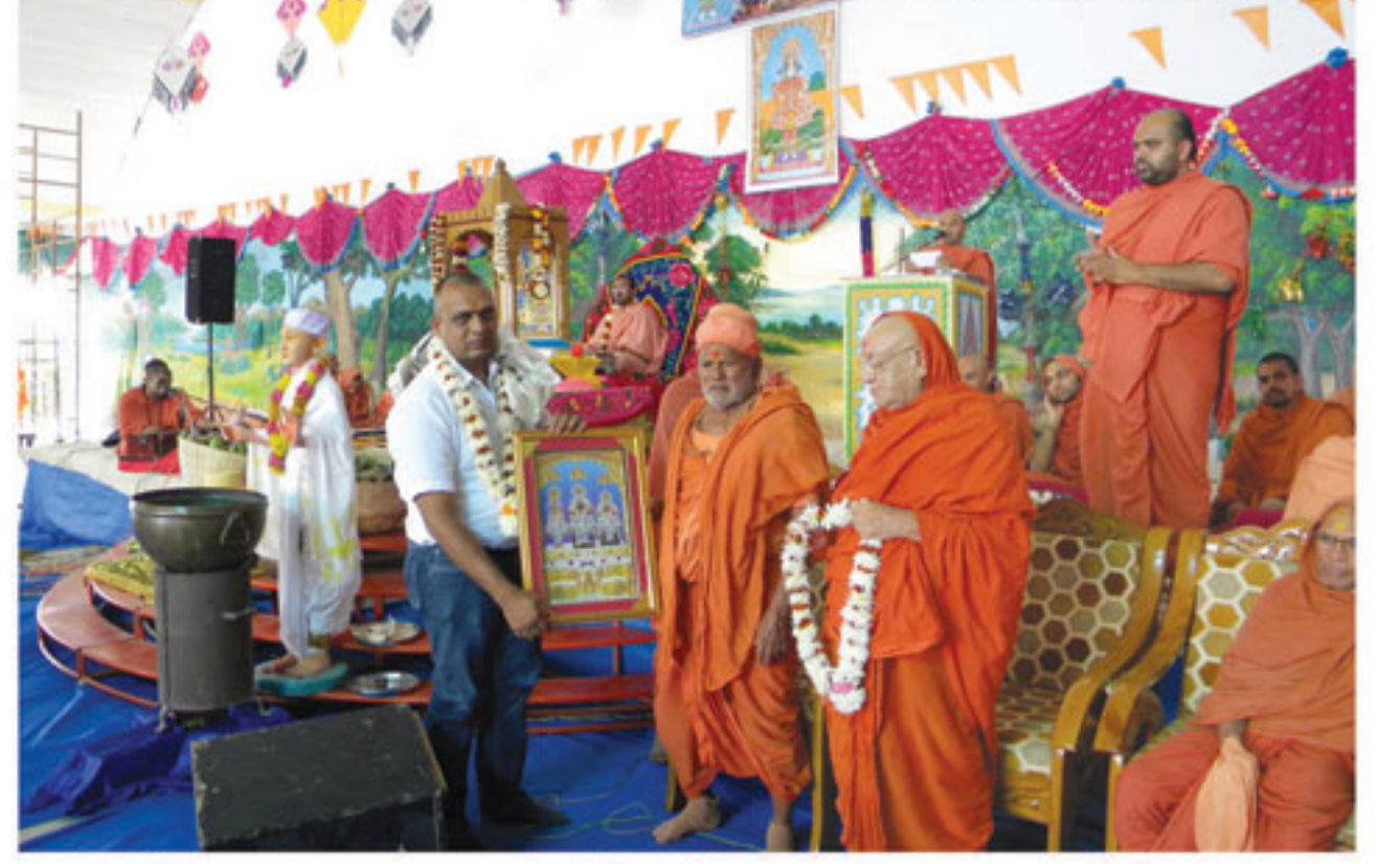
શાકોત્સવના યજમાનશ્રીને પહેરામણી આપતા સંતો, ભુજ