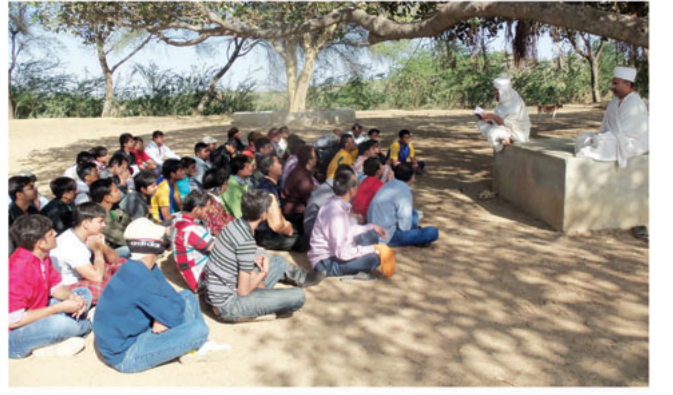
કચ્છ શ્રી નરનારાયણદેવ યુવક મંડળ ભુજ સત્સંગ પ્રવાસ યાત્રા, માનકુવા.