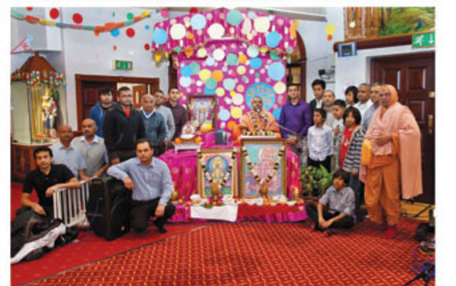
હેરો કેન્ટનના સ્વામિનારાયણ મંદિરમાં ઉમળકાભેર ઉજવાયેલ વાર્ષિક પાટોત્સવની આછી ઝલક