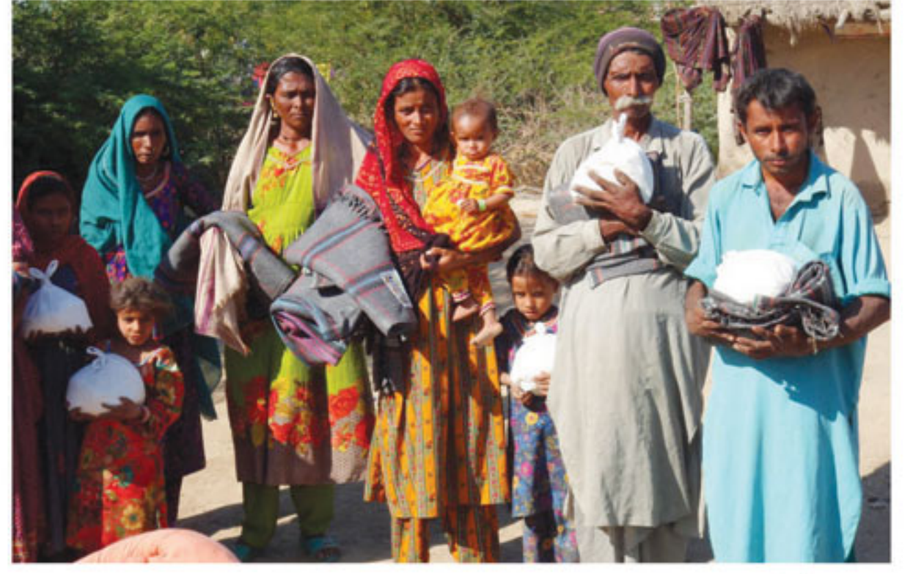
ભુજ શ્રી સ્વામિનારાયણ મંદિર દ્વારા ગરિબોને ઘાબળા તથા અન્નદાન અપાયું